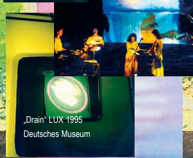
„Drain“ LUX 1995 Deutsches Museum