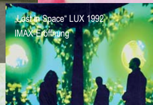
„Lost in Space“ LUX 1992 IMAX-Eröffnung