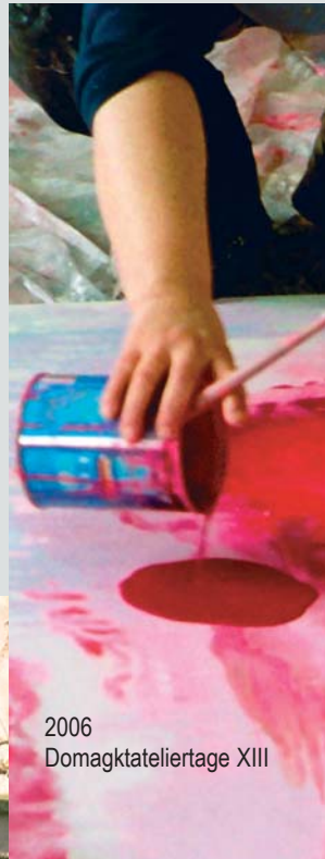
2006 Domagktateliertage XIII