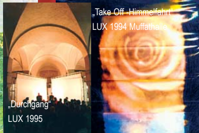
„Take Off - Himmelfahrt“ LUX 1994 Muffathalle